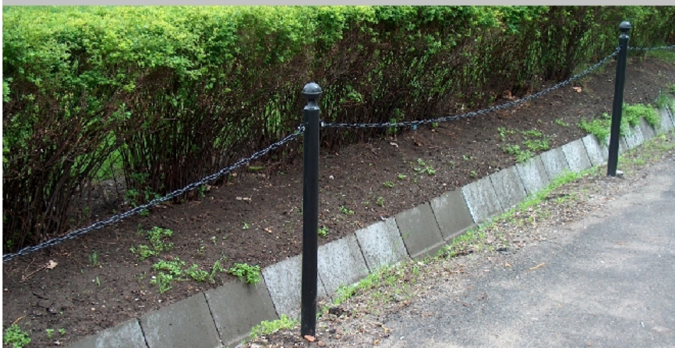
RO1-CS CSŐ OSZLOP LÁNC ÖSSZEKÖTÉSSEL