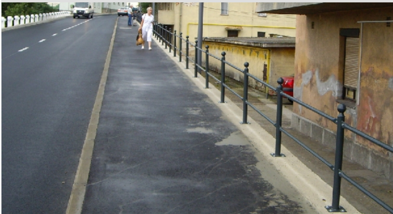
RO1-CS CSŐ OSZLOP CSŐ ÖSSZEKÖTÉSSEL